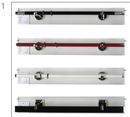
Mustertafeln Plexi 64 cm